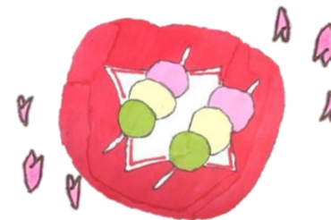
作 小学3年生 お題 花見だんご