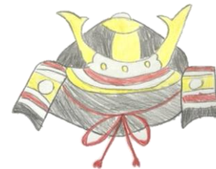
作 小学4年生 お題 かぶと